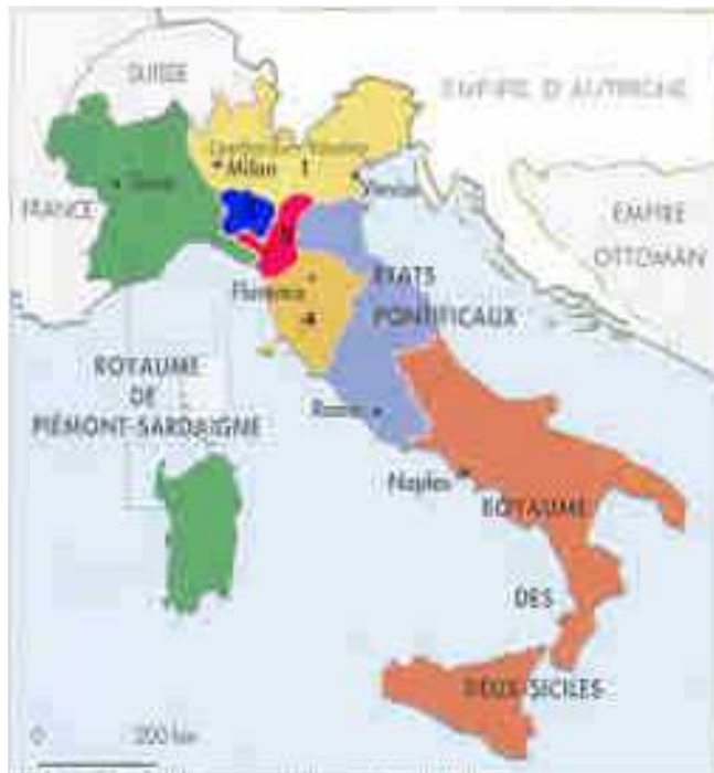
Situation en 1859